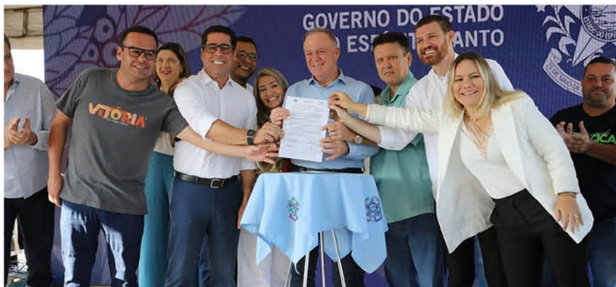
Por: Vandique Magalhães

O prefeito Euclério Sampaio e o governador Renato Casagrande assinaram na manhã desta terça-feira (28) uma ordem de serviço para construção de duas estações de tratamento de esgoto, além da ampliação de redes coletoras em 4 bairros de Cariacica. Os investimentos da ordem de R$ 67 milhões vão beneficiar mais de 70 mil pessoas.